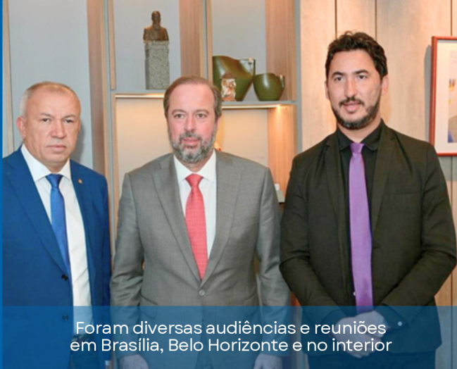
Foram diversas audiências e reuniões em Brasília, Belo Horizonte e no interior

para novas instalações de energia pelo programa Luz para Todos!